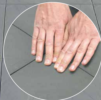
Facile da posare a mano Easy to lay by hand