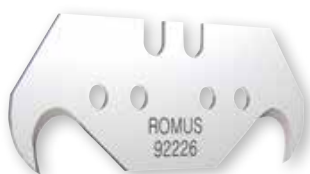
X-cut & W8