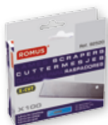
Scatola da 100 lame.