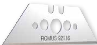
60 mm commutabile