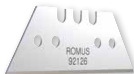
50 mm X-cut & W8