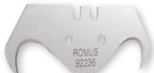
X-cut & w8