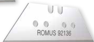
60 mm X-cut & W8