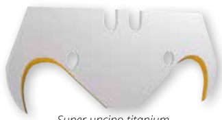
Super uncino titanium