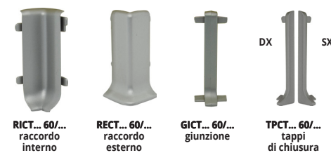
RICT... 60/... raccordo interno RECT... 60/... raccordo esterno GICT... 60/... giunzione TPCT... 60/... tappi di chiusura