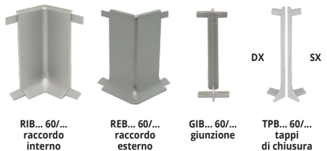
RIB... 60/... raccordo interno REB... 60/... raccordo esterno GIB... 60/... giunzione TPB... 60/... tappi di chiusura