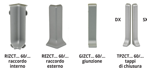
RIZCT... 60/... raccordo interno REZCT... 60/... raccordo esterno GIZCT... 60/... giunzione TPZCT... 60/... tappi di chiusura