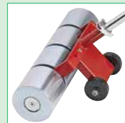
Rotelle di trasporto opzionali

75 kg Larghezza: 38 cm. 3 rulli. Diametro: 180 mm.