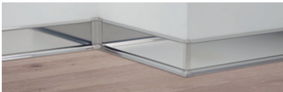
790/6 acciaio inox satinato AISI 304 DIN 1.4301

Metal Line 790, realizzati in acciaio inox e proposti in differenti altezze, sono in linea con le moderne tendenze minimaliste del design e dell'arredo. Grazie all'aletta sporgente garantiscono una perfetta copertura della zona perimetrale, caratteristica che soddisfa la necessità di nascondere gli spazi di dilatazione perimetrale di un pavimento flottante. Sono di rapida e facile installazione a parete mediante l'impiego di idonei collanti.