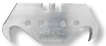
X-CUT e W8