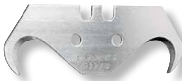
X-CUT e W8