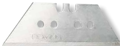
X-CUT e W8