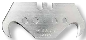
X-CUT e W8