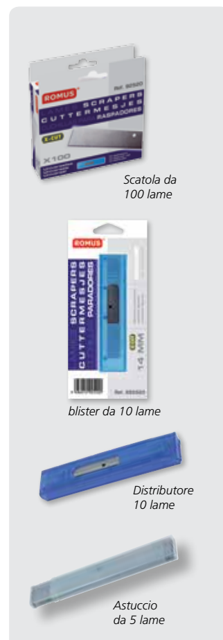
Scatola da 100 lame